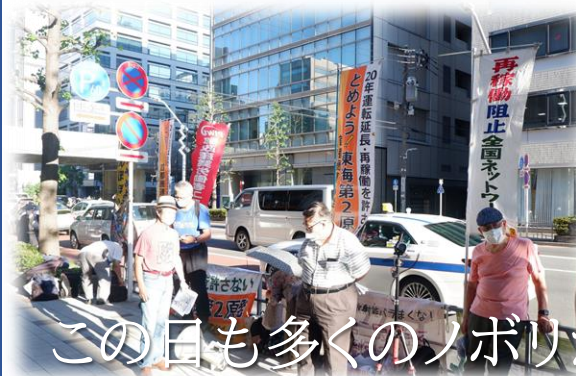
この日も多くのノボリが原電前に掲げられた

さらには、原電が大丈夫とするその第四層の技術的安全対策が、原発事故時において脆弱性を暴露することを指摘し、その技術的安全対策さえも安全でないことを鋭く追及した申入れだった。