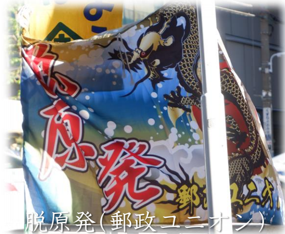
脱原発 (郵政ユニオン)

原電は水戸判決を今からでもしっかりと受け入れ、控訴を取消し、工事を中止して再稼働を断念しろ！私たちも9月11日のオール行動と一緒に参加して共に原電に、再稼働を断念させようじゃありませんか！ありがとうございました！