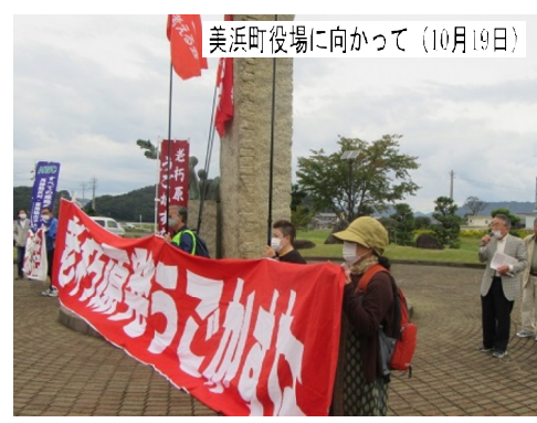
美浜町役場に向かって (10月19日)

10月19日、「美浜町議会臨時会が『美浜発電所3号機の再稼働を求める請願』2件を採択するのでは?」とい