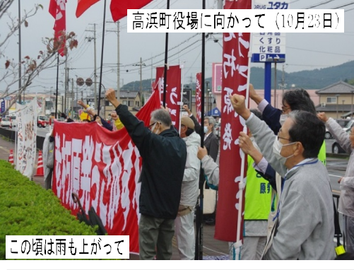
高浜町役場に向かって (10月23日)

この全員協議会が開かれた10月23日には、「老朽原発うごかすな! 実行委員会」の呼びかけで約30人が高浜町役場前に結集し、冷たい秋雨の中、早朝7時半より昼前まで抗議の行動を行い、登庁してくる役員職員等へのチラシ